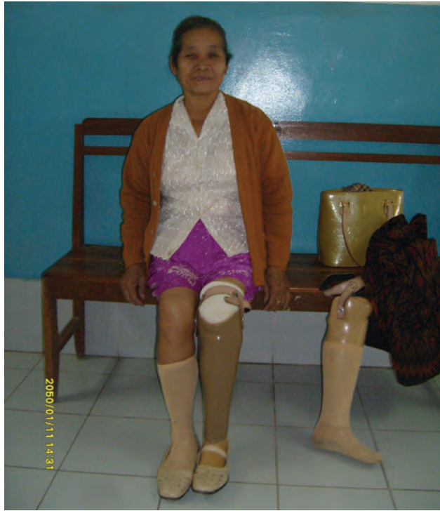
ການວາງສະແດງກ່ຽວກັບລະເບີດລູກຫວ່ານ ຢູ່ທີ່ສູນຢັງມຢາມ ໂຄບ