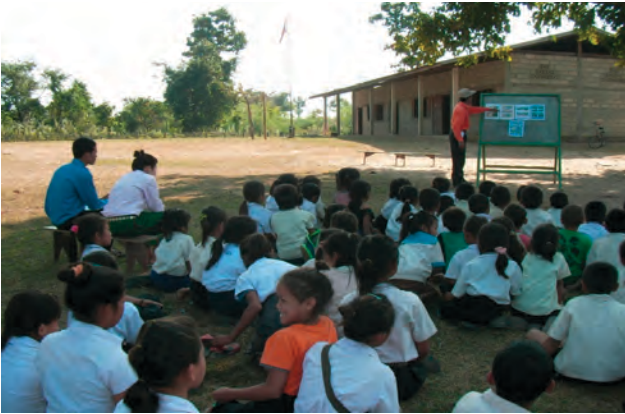
ການດຳເນີນກິດຈະກຳໂຄສະນາສຶກສາຄວາມສ່ຽງໄພຈາກ ລບຕ ຢູ່ ໂຮງຮຽນເຊັນນ້ອຍ

ນອກຈາກ ແບັກເທັກ ໄດ້ມີການສະໜັບສະໜູນ ບັນດາກິດຈະກຳພັດທະນາຕ່າງໆ ທີ່ປະກອບສ່ວນເຂົ້າໃນການພັດທະນາເສດຖະກິດ ຢູ່ໃນ ສປປລາວ ແລ້ວ ບໍລິສັດ ຍັງໄດ້ສືບຕໍ່ຂະຫຍາຍກິດຈະກຳໂຄສະນາສຶກສາຄວາມສ່ຽງໄພຈາກລບຕ ອີກດ້ວຍ. ດັ່ງນັ້ນ, ແບັກເທັກ ຂໍສະແດງຄວາມຮູ້ບຸນຄຸນມາຍັງບັນດາ ລູກຄ້າ ຫຼື ຄູ່ຮ່ວມງານຕ່າງໆ ທີ່ໃຫ້ການສະໜັບສະໜູນຢ່າງເອື້ອເພື່ອເພື່ອແຜ່ ເຮັດໃຫ້ກິດຈະກຳໂຄສະນາສຶກສາຄວາມສ່ຽງໄພ ເກີດຂຶ້ນໄດ້, ເຊິ່ງປະກອບມີລາຍຊື່ລຸ່ມນີ້.