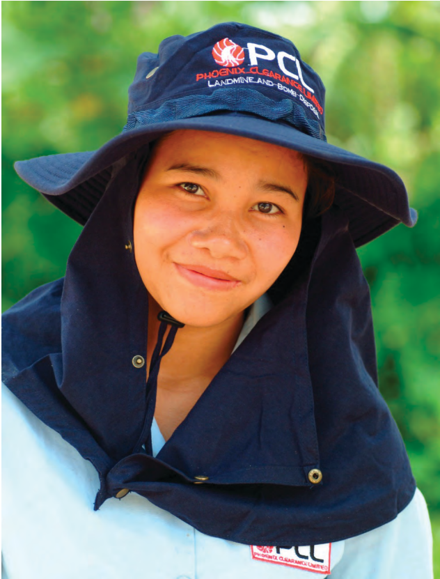
ພະນັກງານກວດກູ້ເພດຍິງ ຂອງ ພິຊີແອວ

ນາຍບ້ານປະຈຳທ້ອງຖິ່ນ ໄດ້ໃຫ້ຄຳເຫັນວ່າ: ພວກເຂົາໂຊກດີ ຍ້ອນວ່າ ໂອກາດດີໆແບບນີ້ສຳລັບໄວໜຸ່ມເພດຍິງ ຢູ່ໃນບ້ານຂອງພວກເຮົາເພື່ອເຂົ້າໄປເຮັດວຽກສ້າງລາຍຮັບໃຫ້ແກ່ຄອບຄົວຂອງຕົນແມ່ນຫາໃສບໍ່ໄດ້ແບບນີ້ອີກແລ້ວ. ທັງໝົດທີ່ຈົບຫຼັກສູດການທຳລາຍລະເບີດ ຂັ້ນ 1 ຈະໄດ້ເຂົ້າເຮັດວຽກກັບ ພິຊີແອວ ແລະ ຈະໄດ້ຮັບເງິນເດືອນ ຫຼື ຄ່າຕອບແທນ ເທົ່າກັບ ເພດຊາຍ.