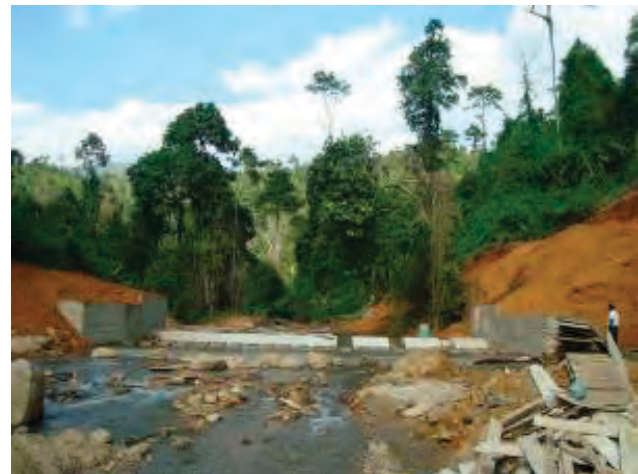
ນີ້ແມ່ນລະບົບ ຊົນລະປະທານ ອີກແຫ່ງໜຶ່ງ ທີ່ທາງອົງການ ເວີວາຍ ຄອນເຊັນ ໄດ້ດໍາເນີນການກໍ່ສ້າງ