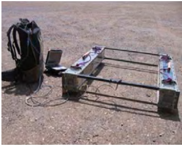
ຕົວສັນຍາກວດຈັບ ແມນ ພອດເທໂບ ເວັກເຕີ (ເອັມພີວີ)

ເອັມພີເອັມ ແມ່ນ ມີຊ່ອງເວລາຫຼາຍຊ່ອງ ແລະ ມີອົງປະກອບທີ່ຫຼາກຫຼາຍ ເປັນຕົ້ນແມ່ນ ເຊັ່ນເຊີ້ຕັ້ງເວລາ ອີເອັມໄອ. ສຳລັບການສຳຫຼວດໃນຄັ້ງນີ້ ເຫັນວ່າມີຄວາມເໝາະສົມທີ່ຈະນຳໃຊ້ຕົວນຳສິ່ງກະແສໄຟຟ້າ ໄປພ້ອມກັບ ລະບົບເຕັກໂນໂລຊີແບບ ແຊມ ພ້ອມດ້ວຍໃຊ້ເປັນຕົວເຮັດໜ້າທີ່ແທນອຸປະກອນຮັບສັນຍາເຄື່ອງກຳເນີດໄຟຟ້າ ທີ່ມີຊື່ວ່າ: “ເຄື່ອງກວດເລິກ ເອັມພີວີ”.