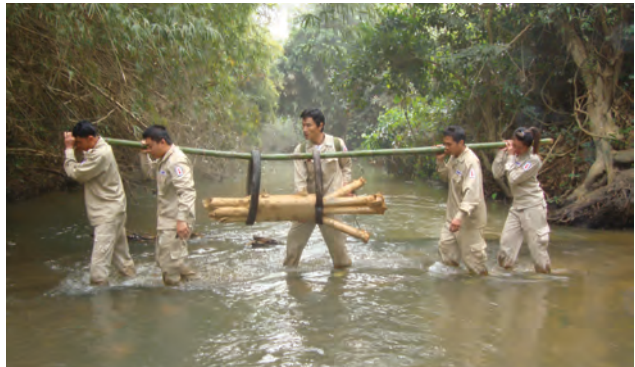
ທີມງານກວດກູ້ ລບຕ ຂອງ ອົງການ ໂຊດີ ໄດ້ຂ້າມຜ່ານສິ່ງທ້າທາຍຫຼາຍຢ່າງທີ່ພວກເຂົາໄດ້ປະເຊີນ ໃນເວລາເຄື່ອນຍ້າຍລະເບີດລູກຫວ່ານອອກຈາກປ່າເພື່ອໄປທຳລາຍ