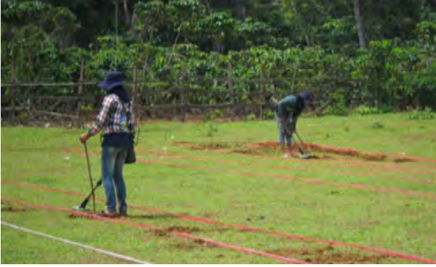
ການດຳເນີນງານຝຶກໃຊ້ເຄື່ອງກວດຕົວຈິງ

ບົດຮຽນແຕ່ລະຢ່າງແມ່ນໄດ້ມີການທົດສອບຢ່າງເປັນທາງການ ແລະ ທົບທວນຄືນ ແລະ ກໍ່ມີການທົດສອບແລ້ວທົດສອບອີກ ຈຶ່ງເຮັດໃຫ້ຂະບວນການ ແລະ ການດຳເນີນງານຕ່າງໆຂອງ ພິຊິແອວ ໄດ້ກາຍເປັນນິໄສຕິດຕົວຂອງບໍລິສັດ.