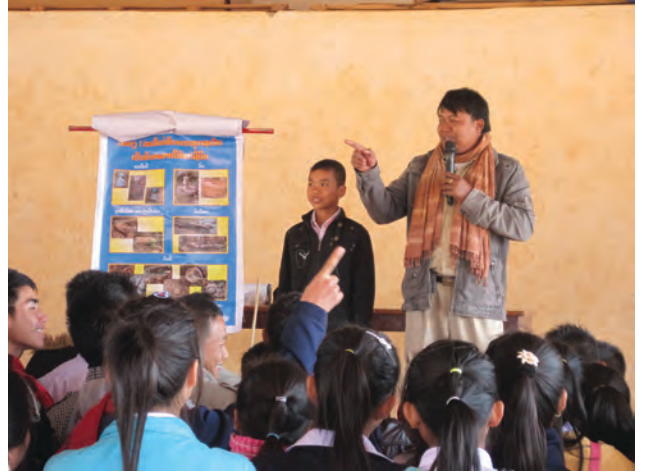
ພະນັກງານໂຄສະນາສຶກສາຄວາມສ່ຽງໄພ ຂອງ ໂຊດີ ກຳລັງສົດສອນນັກຮຽນ ກ່ຽວກັບ ຜົນຮ້າຍຂອງ ລບຕ

ໂຊດີ ມີພະນັກງານວິຊາການກວດກູ້ ແລະ ໂຄສະນາສຶກສາຄວາມສ່ຽງ 20 ຄົນ ລວມທັງແພດສະໜາມເປັນເພດຍິງ. ເຊິ່ງການເຂົ້າຮ່ວມເຮັດວຽກກັບ ໂຊດີ ຈະເບິ່ງຄວາມສຳຄັນເລື່ອງ ຜົນໄດ້ຮັບ ເພື່ອຮັບປະກັນໃຫ້ວຽກງານຂອງໂຄງການສາມາດສົ່ງຜົນປະໂຫຍດໃຫ້ແກ່ບັນດາຊົນເຜົ່າສ່ວນນ້ອຍເປັນພິເສດ.