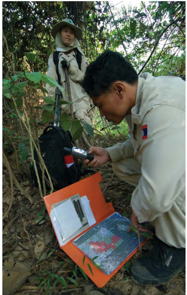
ພະນັກງານຂອງ ເອັນພີເອ ກຳລັງປະຕິບັດງານຢູ່ສະໜາມ

ໃນປີ 2010, ເອັນພີເອ ໄດ້ປັບປຸງຂະບວນການສຳຫຼວດ ເພື່ອປົດປ່ອຍພື້ນທີ່ ເພື່ອສ້າງແຜນທີ່ຂະໜາດຂອງພື້ນທີ່ໆ ຈະສຳຫຼວດ ແລະ ທີ່ຕັ້ງຮ່ອງຮອຍເຂດພື້ນທີ່ກະທົບຂອງ ລະເບີດລູກຫວ່ານ. ໂຄງການທົດລອງດັ່ງກ່າວ ເລີ່ມຕົ້ນຂຶ້ນ ໃນເດືອນ ຕຸລາ ແລະ ເປັນຊ່ວງເວລາດຽວກັນກັບທີ່ກອງປະຊຸມ ລັດພາຄີຄັງທຳອິດຂອງສິນທິສັນຍາ ວ່າດ້ວຍການເກືອດ ຫ້າມລະເບີດລູກຫວ່ານ ດຳເນີນຂຶ້ນໃນເດືອນພະຈິກ ແລະ ໃນເວລານັ້ນເອງ ເອັນພີເອ ກໍ່ພໍດີສຳເລັດການແຕ້ມແຜນທີ່ ເບື້ອງຕົ້ນເຂດພື້ນທີ່ກະທົບຂອງລະເບີດລູກຫວ່ານ ກໍ່ເລີຍ ຂຶ້ນນຳສະເໜີຕົວຢ່າງກ່ຽວກັບ ໂຄງການທົດລອງວ່າດ້ວຍ ການສຳຫຼວດເພື່ອປົດປ່ອຍເນື້ອທີ່ຕ່ຳກອງປະຊຸມ ເພື່ອເຮັດ ແນວໃດ ສປປ ລາວ ຈຶ່ງຈະສາມາດປະຕິບັດໄດ້ຕາມພັນທະ ຂອງສິນທິສັນຍາ.