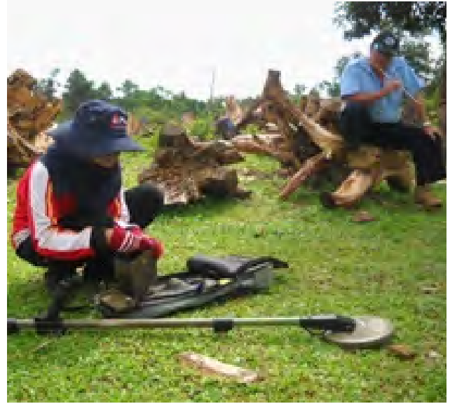
ການທົດສອບຕົວຈິງເຄື່ອງກວດຍີ່ຫໍ້ ມາຍແລ້ບ ຢູ່ສະໜາມ

ໃນມື້ສຸດທ້າຍຂອງການຈົບຟັກສູດ ບັນດານັກຝຶກອົບຮົມເພດຍິງໄດ້ກ່າວວ່າ ພວກເຂົາໄດ້ສຳເລັດການ ຝຶກອົບຮົມແລ້ວ ແລະ ຈະໄດ້ເດີນທາງເພື່ອໄປສົມທົບກັບອີກ 40 ນັກກວດກູ້ ຂອງ ພິຊິແອວ ເພື່ອ ດຳເນີນການກວດກູ້ ລບຕ ໃນ