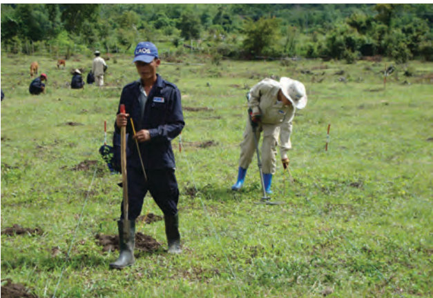
ພະນັກງານກວດກາຄຸນນະພາບ 2 ທ່ານ ທີ່ມາຈາກ ຄຸດຊ ພ້ອມດ້ວຍ ພະນັກງານປະເມີນຜົນ ໄດ້ລົງມາກວດກາຕິດຕາມຢ່າງຖີ່ຖ້ວນ ໃນນາມຕາງໜ້າ ຜູ້ໃຫ້ທຶນ ກໍ່ຄື ກະຊວງການຕ່າງປະເທດ ເຢຍລະມັນ, ເຊິ່ງໃນປີ 2010 ຄະນະດັ່ງກ່າວໄດ້ໃຫ້ຄຳເຫັນວ່າ ໂຊດີ ມີການຈັດຕັ້ງປະຕິບັດໂຄງການໄດ້ ຢ່າງເຕັມສ່ວນ ແລະ ຖືກຕ້ອງຕາມມາດຕະຖານແຫ່ງຊາດ