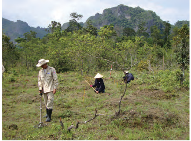
ໜ່ວຍງານກວດກູ້ ກຳລັງໃຊ້ເຄື່ອງກວດ ເພື່ອຄົ້ນຫາລະເບີດລູກຫວ່ານ ແລະ ລບຕ ຊະນິດອື່ນໆ ຢູ່ສະໜາມກວດກູ້

ໂຊດີ ໄດ້ພະຍາຍາມປັບປຸງເນື້ອໃນຂອງ ໂຄງການສຳຫຼວດຂຶ້ນເມືອງ ເພື່ອສະໜັບສະໜູນໃຫ້ແກ່ການກວດກູ້ ລບຕ ແລະ ການກວດກູ້ໂດຍມີຊາວບ້ານຊ່ວຍ ແລະ ປັບປຸງໃຫ້ພວກເຂົາລົງປະຕິບັດໜ້າວຽກຕົວຈິງ.