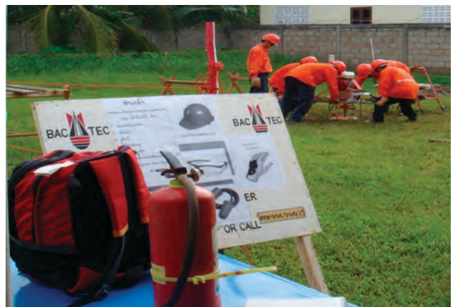
2 ອາທິດ ສຳລັບ ຫຼັກສູດຝຶກອົບຮົມ ກ່ຽວກັບ ການຊຸດເຈາະສຳຫຼວດດ້ວຍເຄື່ອງ ອອກເກີ້

ຢ່າງບໍ່ຕ້ອງສົງໄສ, ສຳລັບສິ່ງທ້າທາຍອັນໃຫຍ່ຫຼວງກວ່າໝູ່ຂອງແບັກເທັກ ຢູ່ ສປປ ລາວ ແມ່ນຈະຕ້ອງສືບຕໍ່ດຳເນີນການກວດກູ້ ລບຕ ໃຫ້ທຽບເທົ່າຕາມມາດຕະຖານການປະຕິບັດຕົວຈິງລະດັບໂລກ ກ່ຽວກັບ ການກວດກູ້ ລບຕ ຢູ່ໃນຕະຫຼາດແຂ່ງຂັນຂອງບັນດາບໍລິສັດເກັບກູ້ລະເບີດ ເພື່ອເພີ່ມ