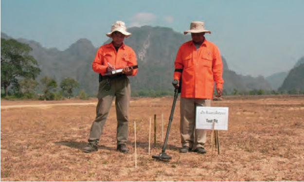
ການທົດສອບເຄື່ອງກວດລະເບີດ ກ່ອນຈະເລີ່ມຕົ້ນດຳເນີນວຽກກວດກູ້ຢູ່ສະໜາມ

ກຸ່ມບໍລິສັດ ແບັກເທັກໂລກ ໄດ້ມາຕັ້ງສາຂາທີ່ ສປປ ລາວ ເພື່ອໃຫ້ບໍລິການອັນມີຄຸນນະພາບສູງໃນການແກ້ໄຂບັນຫາລບຕ/ລະເບີດຝັງດິນ, ພາຍໃນພາກພື້ນ ແລະ ເຂດປາຊີຟິກດ້ວຍ. ບໍລິສັດ ແບັກເທັກ ມີປະສົບການສູງ ໃນການສຳຫຼວດ, ຄົ້ນຫາ, ເປັນທີ່ປຶກສາ, ການຝຶກອົບຮົມ ແລະ ການເກັບກູ້ເນື້ອທີ່ຕົກຄ້າງຈາກ ລບຕ/ລະເບີດຝັງດິນ ທີ່ເສດເຫຼືອປາງສິງຄາມ, ທັງໃນພື້ນທີ່ດິນ ແລະ ຢູ່ໃຕ້ນ້ຳ ດ້ວຍ. ບໍລິສັດ ແບັກເທັກ ສາມາດບໍລິການທຸກຢ່າງທີ່ກ່ຽວຂ້ອງກັບລະເບີດ.